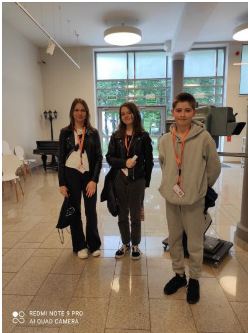
Reprezentanci PSP nr 3 w Ozimku

W związku z trzema ważnymi dla naszej gminy rocznicami: 60 - leciem otrzymania praw miejskich przez Ozimek, 30 - leciem partnerstwa z Heinsbergiem oraz 25 - leciem partnerstwa z Rýmařovem biblioteka miejska we współpracy ze Stowarzyszeniem "Dolina Małej Panwi" zorganizowała Międzyszkolny Turniej Wiedzy o Ozimku, który odbył się 30 maja 2022 r. Wzięło w nim udział 7 trzyosobowych drużyn reprezentujących: PSP w Antoniowie, PSP w Grodźcu, PSP w Krasiejowie, PSP w Dylakach, PSP w Szczedrzyku, PSP nr 1 w Ozimku oraz PSP nr 3 w Ozimku.